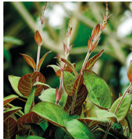
Käsepfanze | Paederia lanugino

Zarter Geschmack nach Camembert. Ideal zum Rohverzehr im Salat oder schonend gedämpft als feine Beilage.