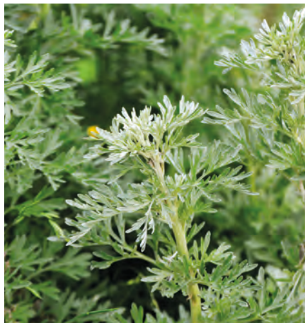
Gyroskraut | Artemisia caucasica

Das Aroma erinnert an Lorbeer und Thymian und kann frisch oder getrocknet für Salate, Fleischgerichte, Pasta und Soßen verwendet werden.