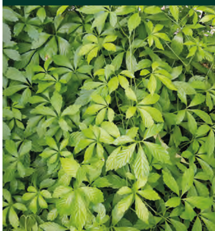
Kraut des Lebens |