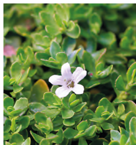
Brahmi | Bacopa monnieri

Fördert das Gedächtnis und die geistige Leistungsfähigkeit. Die Sprosssteile können frisch oder getrocknet zur Teebereitung verwendet werden.