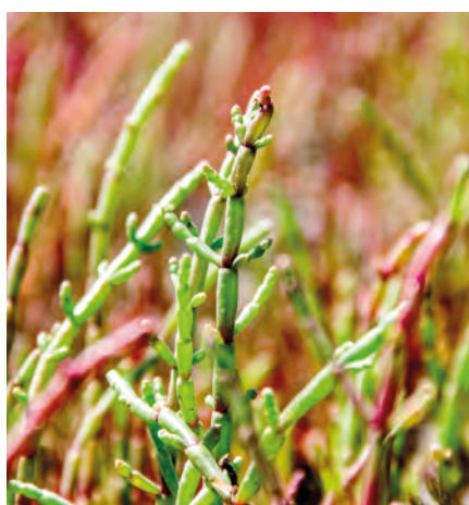
Salzkraut | Salicornia europaea

Pflanze mit salzigen Stängeln und winzigen Blättern, die sich gut als Salatzugabe eignen.