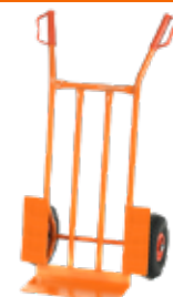
SACKKARRE – 2 RÄDER

¹Aktion gültig von 01.02.2026 - 28.02.2026 in teilnehmenden OBI Märkten mit OBI Mietgeräteservice. Rabattfähig sind nur die abgebildeten Geräte. Rabatt ist nicht auf andere Mietgeräte anwendbar. Automatischer Abzug an der Kasse.